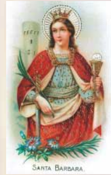
In alto: un'immaginetta di Santa Barbara. In basso: le candelore o varette, all'interno della Chiesa di Santa Barbara. In basso a sinistra: il busto che custodisce le Reliquie della Santa.