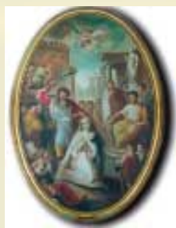
Il martirio di Santa Barbara.

TRIDUO SOLENNE 30 Novembre, 1 e 2 Dicembre "Eucarestia e Martirio: Pane spezzato per la vita del mondo".