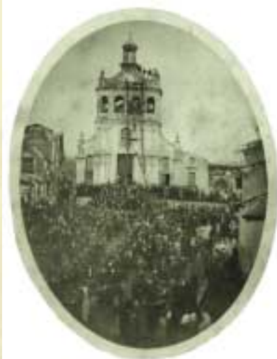
Si inaugura la campana di nome Giovanni, foto del secolo scorso.

affanni, Ed il nome di Giovanni, Sono gli angeli a cantar! Sopra Solima passò