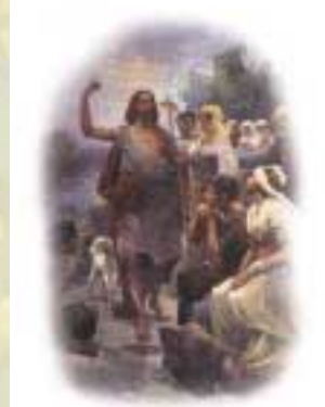
Tela di Francesco Mancini, inizi del XX secolo.