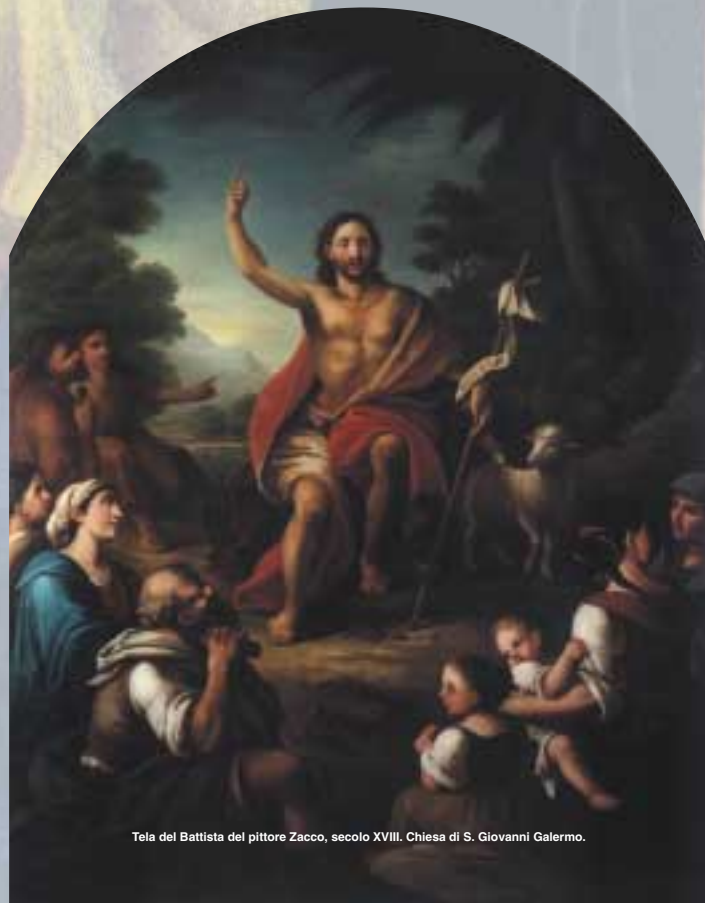
Tela del Battista del pittore Zacco, secolo XVIII. Chiesa di S. Giovanni Galermo.