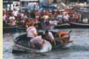
La Sagra del Pesce a Mare.

Accorre il popolo di Trezza, s'accendono le luci di festa. S'alza la mano osannante e nasce un canto dal cuore.