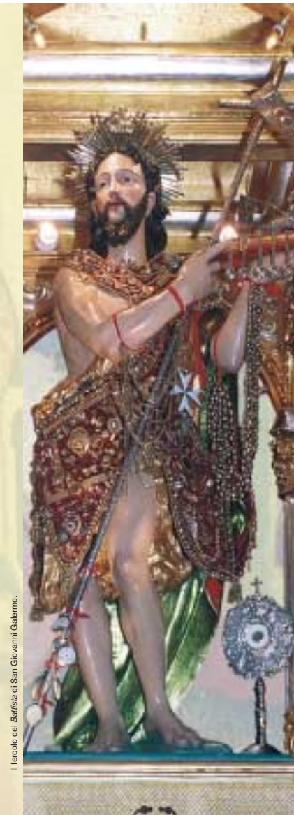
Il fercolo del Battista di San Giovanni Galermo.