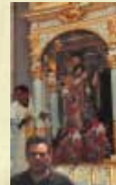
La trionfale uscita del fercolo a mezzogiorno.

Sul fercolo, opera lignea del 1720 a sei colonne di stile corinzio recentemente restaurato, si