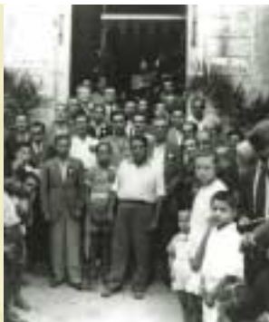
S. Giovanni Battista in via Rancore, col fercolo a Baldacchino.