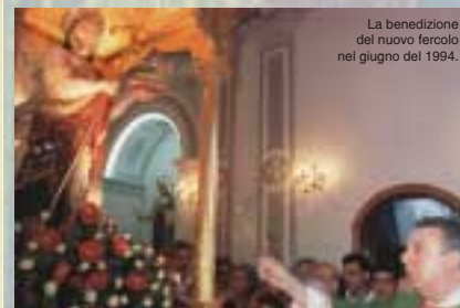
La benedizione del nuovo fercolo nel giugno del 1994.