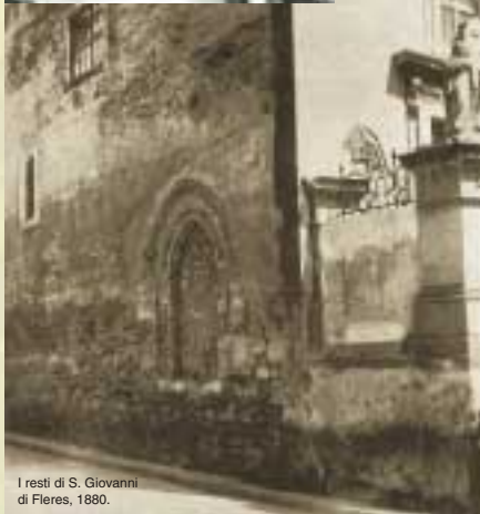
I resti di S. Giovanni di Fleres, 1890.