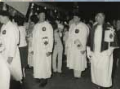
La storica Confraternita in processione.