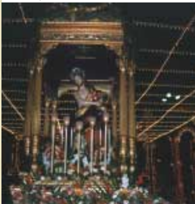
Il fercolo in processione.