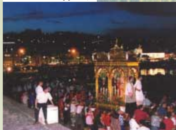
Acitrezza: la Processione del 24 giugno a sera.